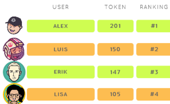
Esempio delle classifiche (leaderboard)

Facciamo un esempio per valutare gli impatti economici delle ricompense sul totale fondi raccolti in Monero. Supponendo che per un progetto possono esserci N minatori e che il minatore Alex sia primo in Classifica singola del progetto: